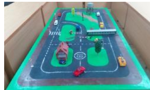
Рис 1. Предметная модель «Место ДТП»

В настоящее время кафедрой разработаны две предметные модели «Место ДТП», «Квартира», которые предполагается разместить в комплексном криминалистическом полигоне (рис. 1, 2).